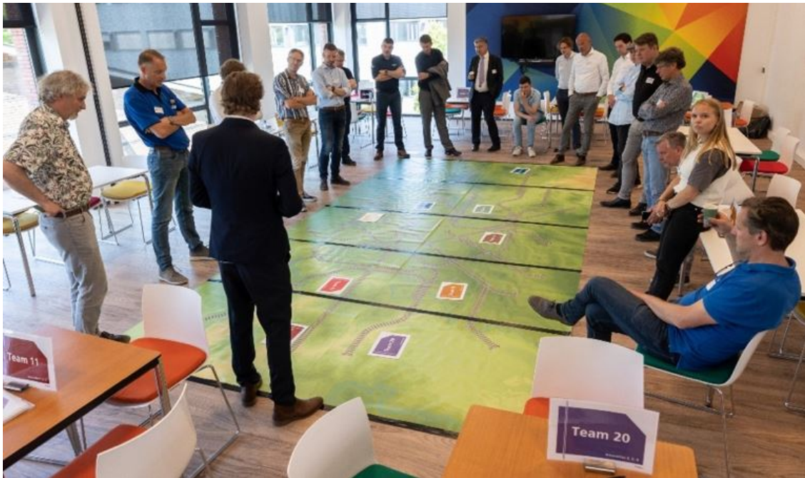
Serious gaming: ideeën opdoen voor snellere invoering ERTMS

Op 7 juni organiseerde ProRail het event ASAP ontketend! ASAP staat voor Aanbesteding Snellere Aanpak ERTMS. De aanbesteding leverde 9 innovatiepartners op die samen met ProRail werken aan 11 innovaties. Deze moeten bijdragen aan een snellere landelijke uitrol van ERTMS. Aan het event in het Railcenter in Amersfoort deden meer dan 100 ProRailmedewerkers mee, plus de innovatiepartners, ingenieursbureaus, aannemers en andere belanghebbenden.