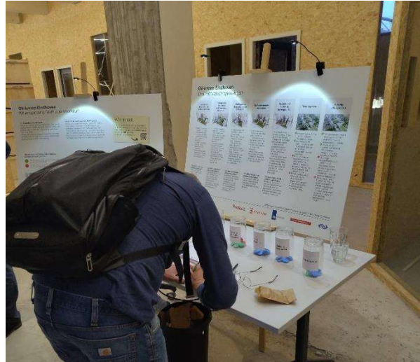
Bezoeker stemt op een oplossing