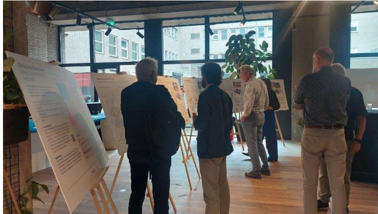
Bezoekers bekijken de panelen

De verschillende oplossingen stonden op panelen toegelicht met afbeeldingen en kenmerken van de oplossing. Er waren vijf panelen voor oplossingen voor het busstation, fietsenstalling en het stationsgebouw. Eén paneel voor drie mogelijke aanpassingen van de sporen ten westen van Eindhoven Centraal. En twee panelen voor twee extra perrons op station Eindhoven Centraal. Bij de panelen stonden projectmedewerkers om vragen te beantwoorden of de panelen extra toe te lichten.