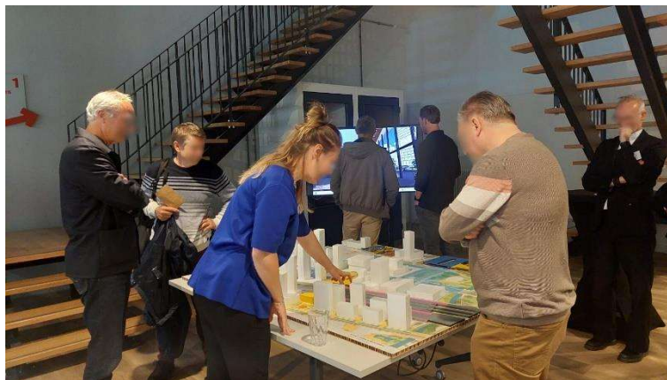
Bezoekers bekijken de maquette van de oplossingen samen met een projectmedewerker

Ook was er een tv-scherm waarop in een 3D-animatie alle oplossingen te zien waren. In deze animatie werd de kijker door de verschillende oplossingen van de treinperrons, het busstation, de stationshal, het stationsplein en de fietsenstalling meegenomen.