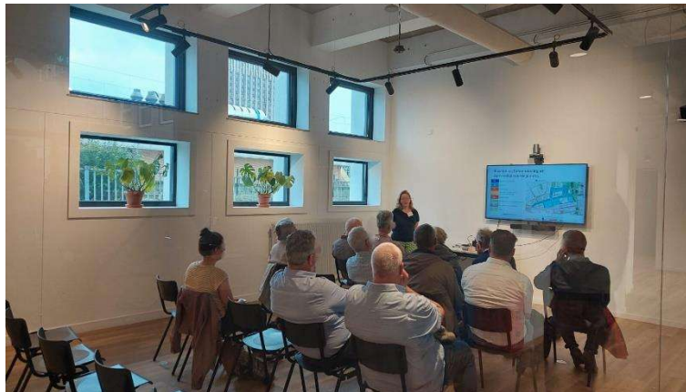
Presentatie over de OV-knoop

Zowel 's middags als 's avonds was iedereen welkom om langs te komen in Microstad, gelegen naast station Eindhoven Centraal.