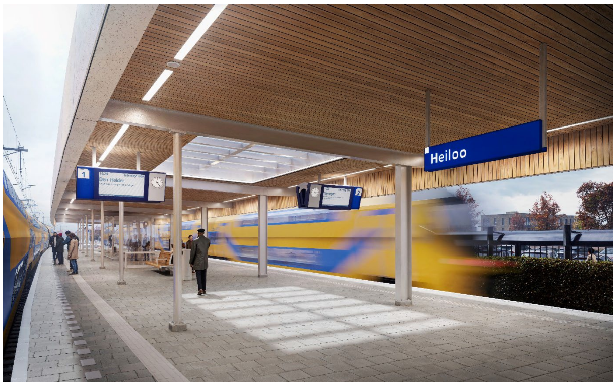
Visual 1: een vernieuwd station Heiloo met nieuwe perronkap en glazen wachtruimte.

Er komt een transparant en comfortabel wachtruimtepaviljoen met ruime openingstijden, wat bijdraagt aan een veiligere, toegankelijker en open uitstraling van het station.