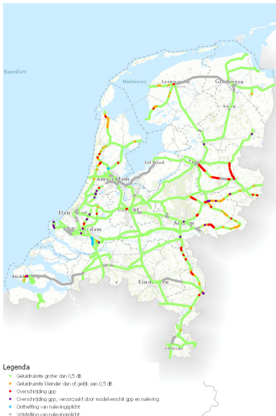
Figuur 2: Landelijk beeld van de gpp-naleving in 2018