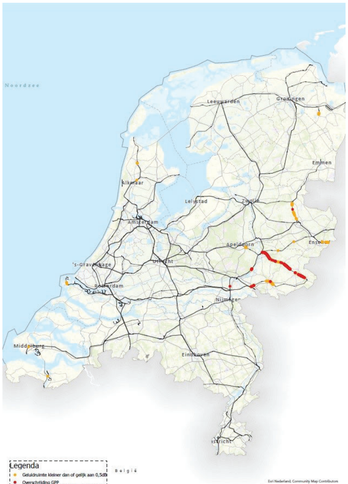
Figuur 1: Landelijk beeld van gpp-overschrijdingen en baanvakken met een krappe geluidruimte