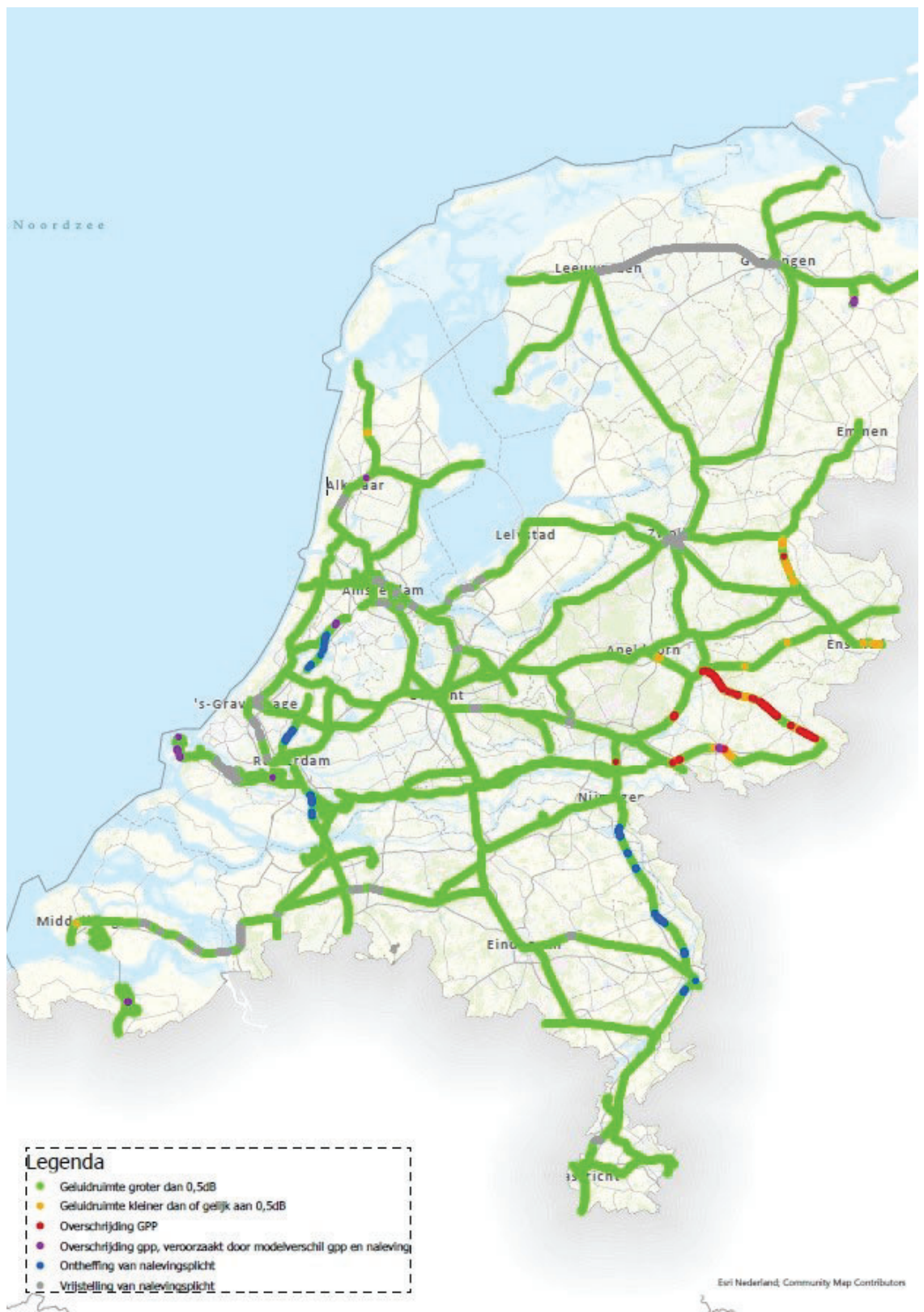
Figuur 2: Landelijk beeld van de gpp-naleving in 2021