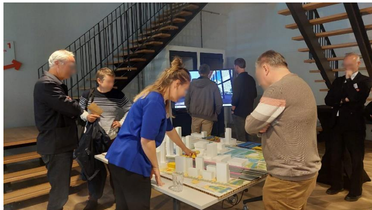
Bezoekers bekijken de maquette van de oplossingen samen met een projectmedewerker

Ook was er een tv-scherm waarop in een 3D-animatie alle oplossingen te zien waren. In deze animatie werd de kijker door de verschillende oplossingen van de treinperrons, het busstation, de stationshal, het stationsplein en de fietsenstalling meegenomen.