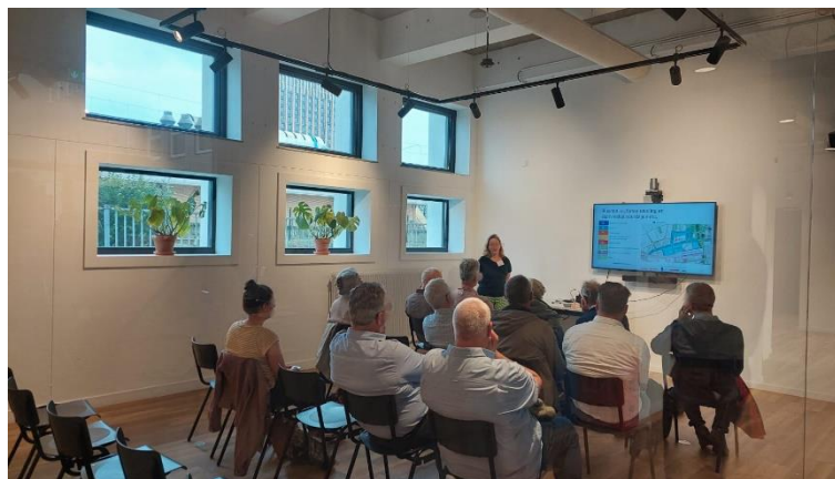
Presentatie over de OV-knoop

Zowel 's middags als 's avonds was iedereen welkom om langs te komen in Microstad, gelegen naast station Eindhoven Centraal.