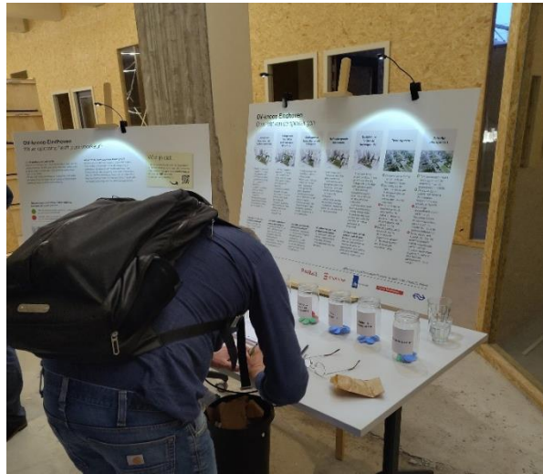
Bezoeker stemt op een oplossing