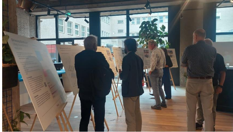
Bezoekers bekijken de panelen

De verschillende oplossingen stonden op panelen toegelicht met afbeeldingen en kenmerken van de oplossing. Er waren vijf panelen voor oplossingen voor het busstation, fietsenstalling en het stationsgebouw. Eén paneel voor drie mogelijke aanpassingen van de sporen ten westen van Eindhoven Centraal. En twee panelen voor twee extra perrons op station Eindhoven Centraal. Bij de panelen stonden projectmedewerkers om vragen te beantwoorden of de panelen extra toe te lichten.